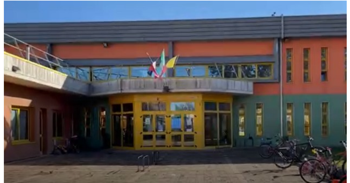
Scuola Primaria Alessandro Manzoni

Istituto Comprensivo «Virginio Muzio» - Bergamo